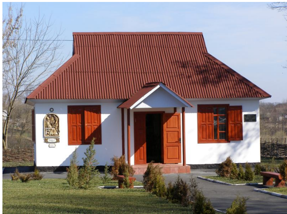
Музей М.С. Грушевського, с. Сестринівка Козятинського району.