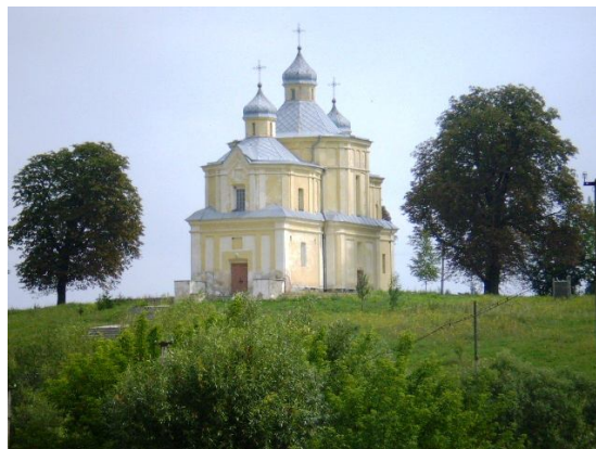
Свято-Преображенська церква с. Полічинці

Історико-релігійознавчі: «Свято-Преображенська церква», «Пам'ятки sacramентального мистецтва» (архітектури);