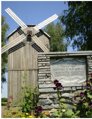
Музей Хліба Вінницька область, Козятинський район, с. Білопілля