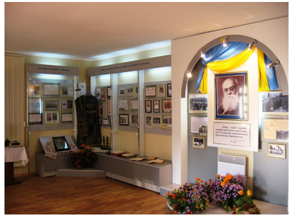
В музеї М.С. Грушевського, с. Сестринівка Козятинського району

У садибі діда вдячні земляки спорудили музей М.С. Грушевського. В експозиції представлено родовід великої і благородної родини Оппокових, матеріали про діда, Захарія Оппокова, священника Покровської церкви с. Сестринівки, який відіграв визначальну роль у становленні світогляду молодого М.С. Грушевського. Можливо, колись відкриють туристичний маршрут «По місцях Михайла Грушевського», і цей сільський музей повноправно ввійде до ланцюгу меморіальних місць Грушевського.