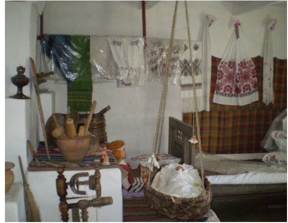
Музей Хліба Вінницька область, Козятинський район, с. Білопілля

Мандруючи цим мальовничим краєм, ви обов'язково відвідаєте оригінальний музей Хліба, що у селі з милозвучною назвою Білопілля, яке здавна славиться хліборобською справою. Багато-багато років тому, у ХУІІІ ст. у Білопіллі жив звичайний чоловік на ім'я Федір Білошкап. Ще за молодих років, після смерті батьків, залишився він з двома молодшими сестричками на руках. Життя у родини було несолодке. Багато горя випало на їхню долю. Та про доброзичливість і щирість Білошкапів у селі згадують ще й сьогодні. Вітряк, який у свій час сотням людей з усієї округи перемолов чимало пшениці збудував власними руками Федір. Млин стоїть і досі у центрі села. Дивлячись на його п'ятнадцятиметрову горду «поставу», яку видно далеко за селом, навіть не віриться, що з'явився він ще у ХУІІІ ст. Біля нього згодом створили музей хліба. Спочатку реставрували вітряк, добудували клуню і хату.